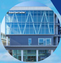
神戸アイセンター病院