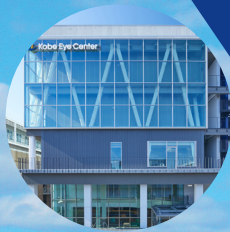
神戸アイセンター病院