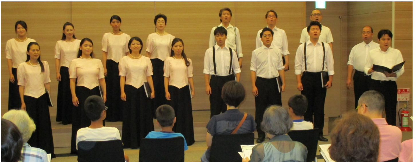
神戸市混声合唱団の皆さん

アロマボランティアの皆さんは、毎回プログラム配布や席への誘導等でコンサートの進行に協力して頂いています。また、コンサート終了時にはアロマの香りをまとった折り紙を皆さんに配布もしています。