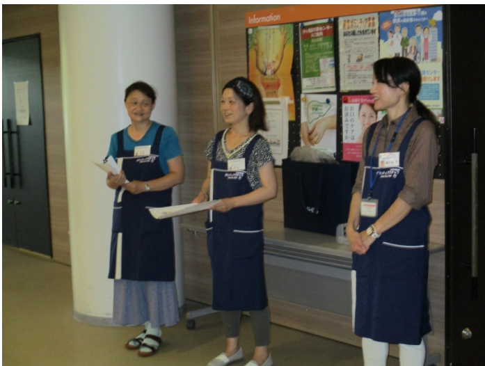
アロマボランティアの皆さんにプログラム配布をお願いしています。