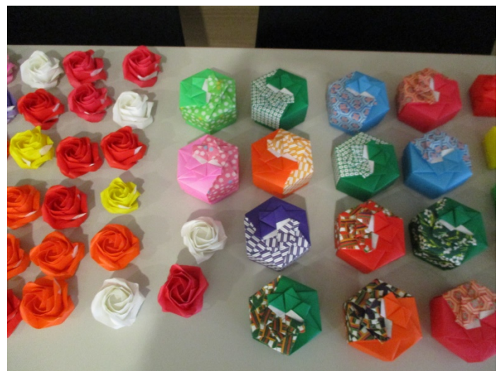
折り紙にアロマの香りをまとわせ、コンサート終了時に皆さんに配布しています。