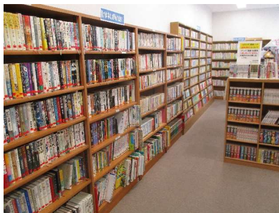
ボランティア図書室