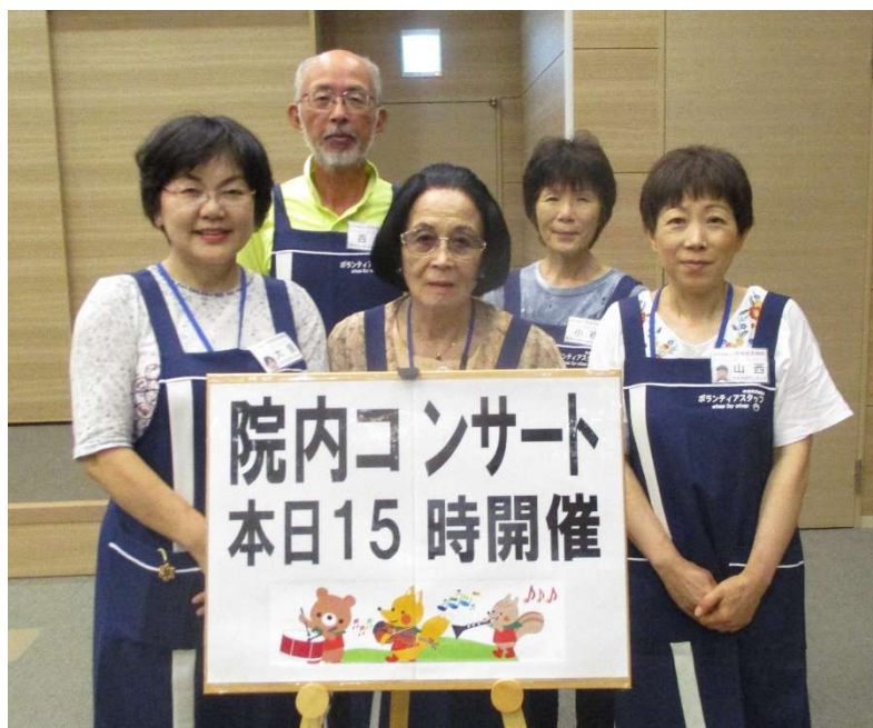
進行を協力して頂いたボランティアのみなさん