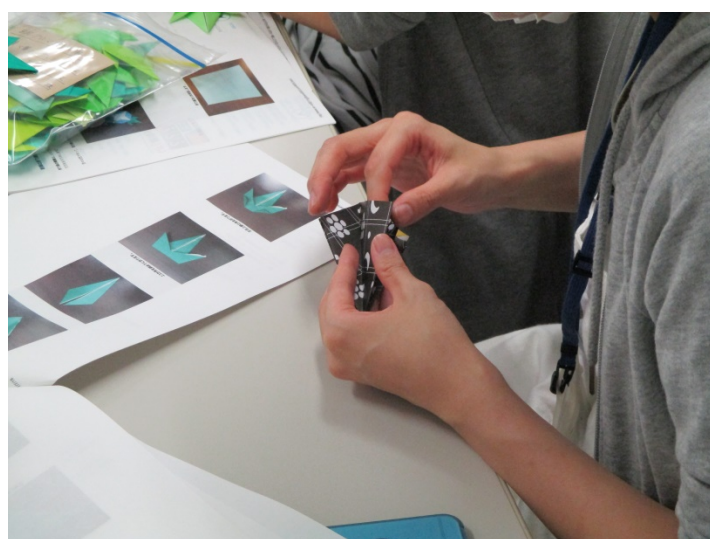
朝顔の折り紙（※難易度は高いです）