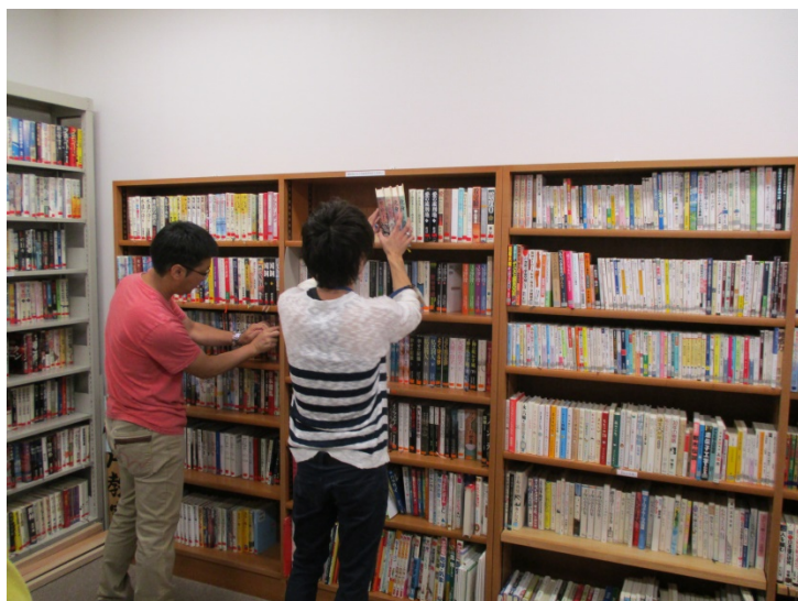
図書室の棚の改修作業

図書室の棚の改修作業と、会議室に集まって夏まつり（小児病棟）のうちわ作りと院内コンサートで患者さんにお配りする折り紙作りをお願いしました。