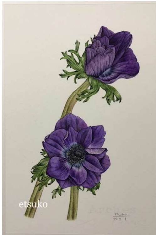
1月 アネモネ／キンポウゲ科

「etsukoの植物画ブログ」 http://shokubutsu.livedoor.biz