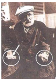
ルノワールの時代はアスピリンのみ