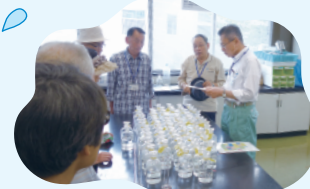
水質試験所の見学

約60人を募集。1回の参加につき、クオカード1,000円分、その他オリジナルグッズを差し上げます。