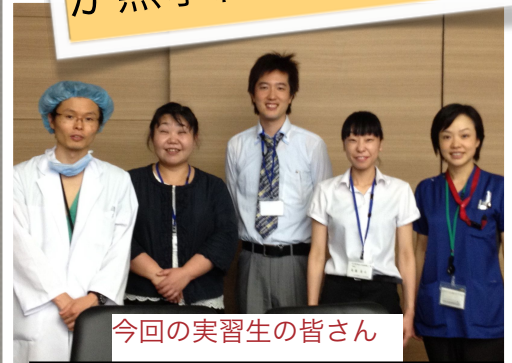
今回の実習生の皆さん

6/11-15、当院で第3回の専門療法士実地修練が行われ、今回は3名の方が受講していただきました。当院はあくまでNST専門療法士を受験する方のみを募集しておりますので、他の条件(5年以上の臨床経験、日本静脈経腸栄養学会参加、教育セミナー参加、合計30単位以上の勉強会受講など)を満たしている方々のみ受講となっています。そのため申し込みはもっと多くの方からしていただいたのですが今回は3名でした。今回も講義を様々な方々にお願ひしました。協力していただいた皆様、ありがとうございました。また他院のNSTのお話を聞けて、我々もいい刺激になりました。ありがとうございました。