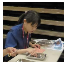
★毎月恒例★歯科女子会