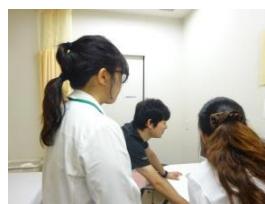
▲初期研修医同行 救急のシステムについ て、説明しています。