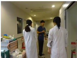
▲初期研修医同行 病棟を案内しています。