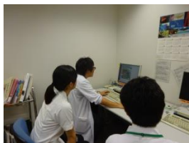
▲初期研修医同行 医療情報システムについて 説明しています。