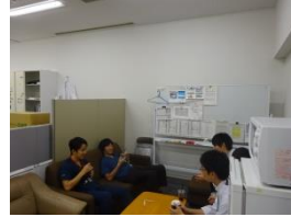
▲初期研修医同行 初期研修医室でまったり 質問タイム♪