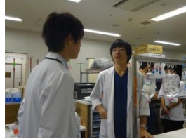
▲初期研修医同行 救急での対応について 説明しています。