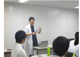
▲初期研修医システム説明 見学のポイントもあわせ て当院の魅力をアピール