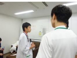
▲初期研修医同行 同行の最終地点は、 初期研修医室★