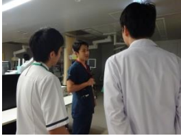
▲初期研修医同行 救急まわりを 案内しています。