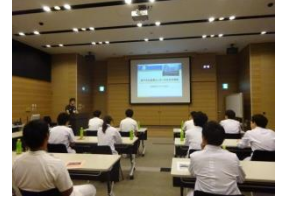
▲初期研修医システム説明 安心して働ける研修シ テムである事を説明！