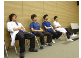
▲初期研修医の先生が 見学に来てくれました。