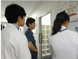
▲初期研修医同行 2階の医局回りの 案内をしています。