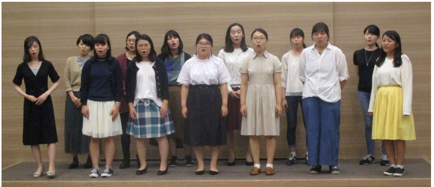
神戸市看護大学コーラルレインのみなさん